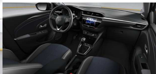
Corsa Elegance 1.2, 55 kW (75 PS), Start/Stop, Euro 6d (Manuelles 5-Gang Getriebe) Mondstein Grau (Metallic), Stoff Imagination, Dunkelblau/Premium-Lederoptik, Schwarz