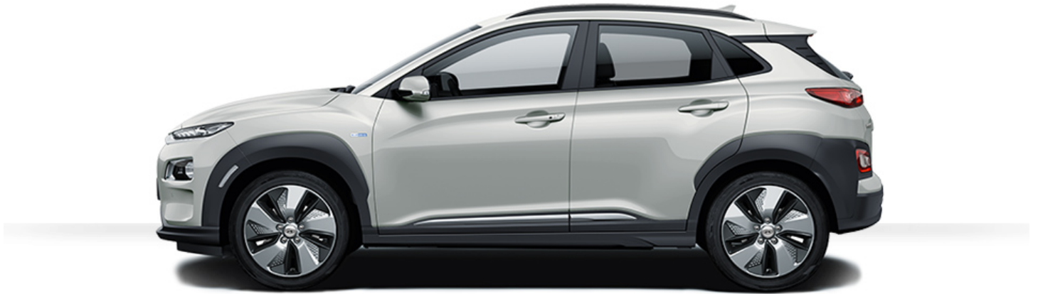
Abbildung ist als unverbindlich zu betrachten. Fahrzeugabbildungen enthalten z. T. aufpreispflichtige Sonderausstattungen.