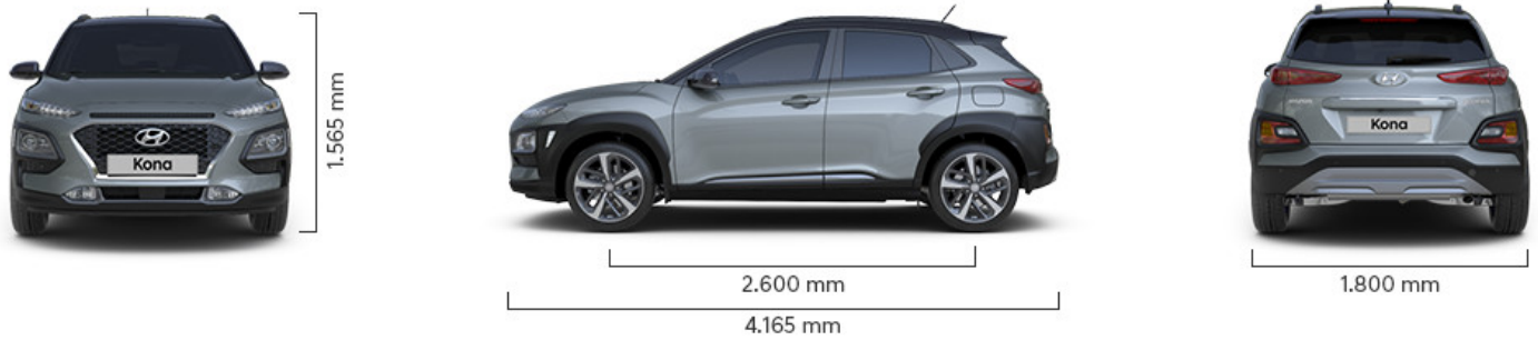
Abbildung ist als unverbindlich zu betrachten. Fahrzeugabbildungen enthalten z. T. aufpreispflichtige Sonderausstattungen.