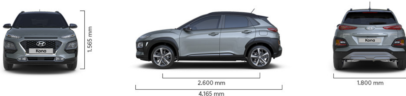
Abbildung ist als unverbindlich zu betrachten. Fahrzeugabbildungen enthalten z. T. aufpreispflichtige Sonderausstattungen.