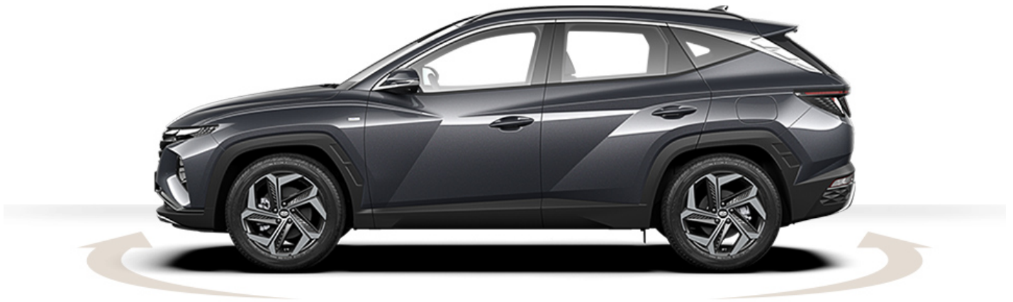
Abbildung ist als unverbindlich zu betrachten. Fahrzeugabbildungen enthalten z. T. aufpreispflichtige Sonderausstattungen.