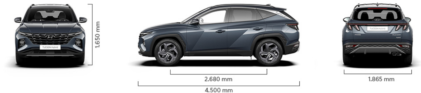
Abbildung ist als unverbindlich zu betrachten. Fahrzeugabbildungen enthalten z. T. aufpreispflichtige Sonderausstattungen.