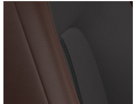
INNENRAUMKONZEPT INDUSTRIAL VINTAGE