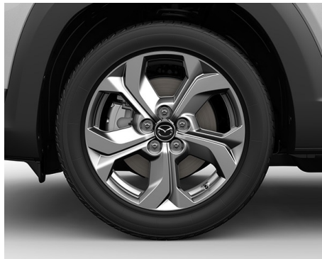
18-ZOLL-LEICHTMETALLFELGEN IN SILBERGRAU MIT HOCHGLANZFINISH UND 215/55 R18 BEREIFUNG