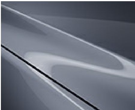
POLYMETAL GRAU METALLIC